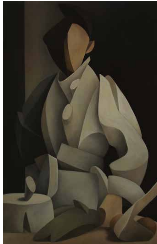
Chef oil on canvas, 119 x 76 cm