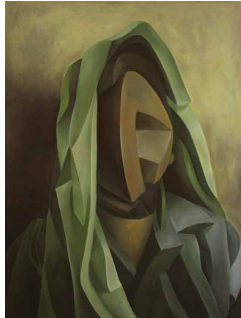
Green smile oil on canvas, 80 x 60 cm