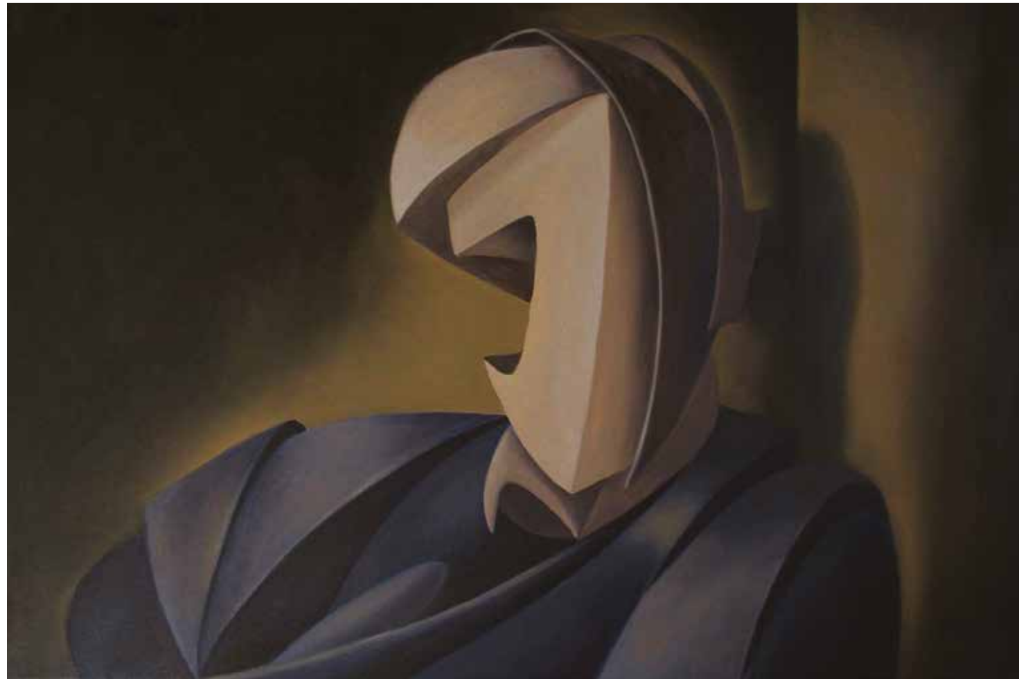
Secret oil on canvas, 40 x 60 cm