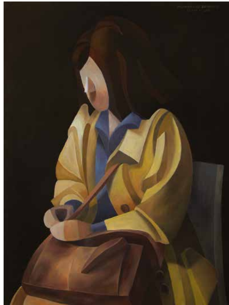
Eavesdropping oil on canvas, 70 x 70 cm