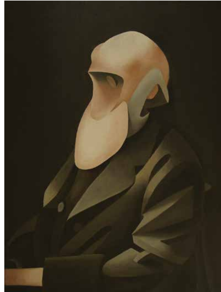
Experience oil on canvas, 60 x 45 cm