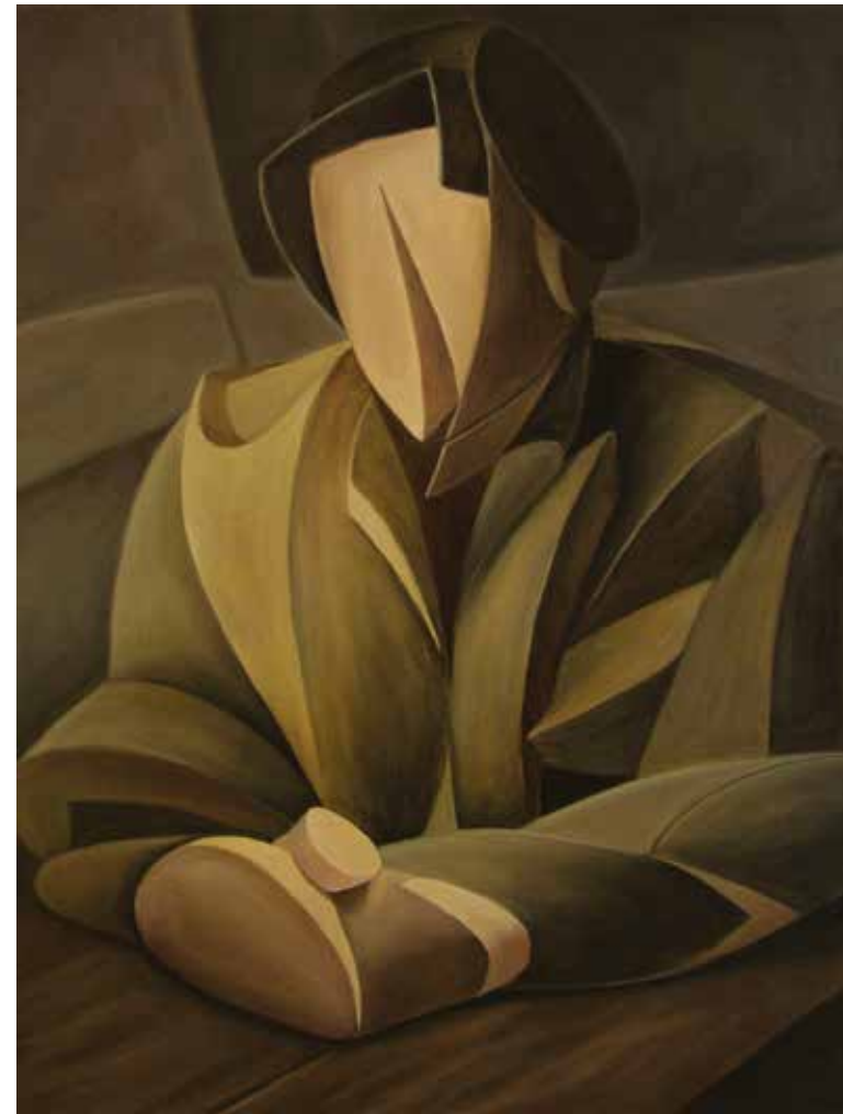
Brown figure oil on canvas, 100 x 60 cm